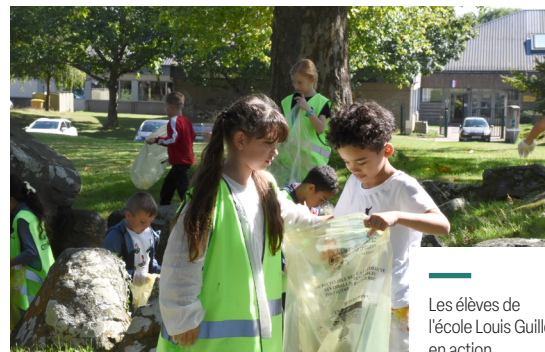
Les élèves de l'école Louis Guilloux en action.

** mis en place par les Nations unies en 2015.