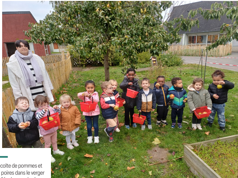
Récolte de pommes et de poires dans le verger de l'école, avec la classe de TPS/PS de l'école des Villes Moisan.

Deux écoles de Ploufragan viennent d'obtenir le label E3D*, décerné par l'Éducation nationale, qui fait de l'école un lieu d'apprentissage global du développement durable. Cette reconnaissance valorise les actions menées par l'école primaire Louise Michel et l'école maternelle des Villes Moisan qui impliquent élèves, enseignants, parents et personnel dans des projets concrets d'éducation environnementale. En pratique, ça se traduit comment ? La parole aux directrices.