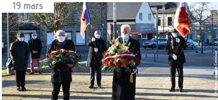
La commémoration du 19 mars 1962 s'est déroulée en formule restreinte.