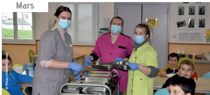
Les agents municipaux respectent les consignes sanitaires en vigueur, comme ici, les agents de la restauration scolaire.