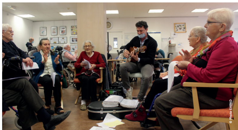
Samedi 27 mars, cette année sans les familles, c'était la fête de printemps à l'Ehpad Foyer d'Argoat.