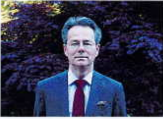
Stéphane ROUVE Préfet des Côtes d'Armor