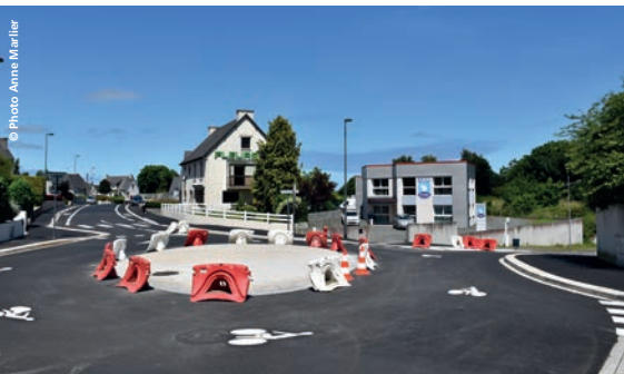
Finalisation de l'aménagement de la rue du Calvaire, fin juin.