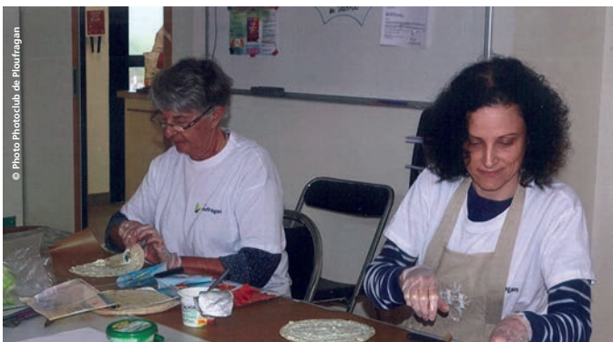
Préparation du temps convivial : 8 volontaires (photo du reportage réalisé par 5 membres du Photo club de Ploufragan pour cette journée).

Pour sa première édition, la Journée citoyenne ploufraganaise a été une belle réussite malgré une météo peu engageante. Une centaine de volontaires ont répondu présents et 75 sont restés pour partager le repas du midi préparé par des volontaires.