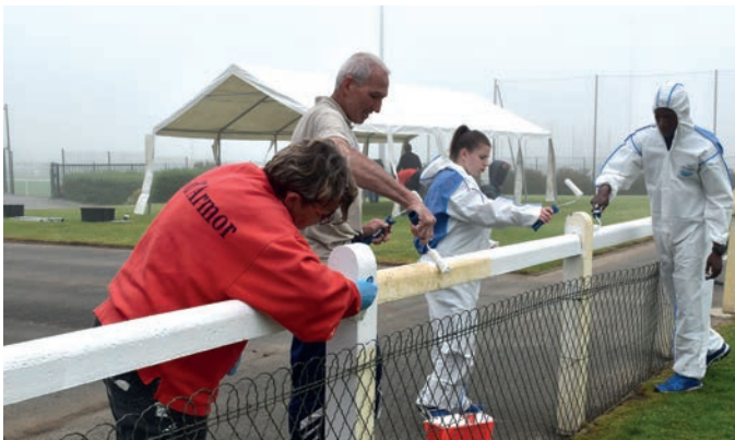
Peinture de la main courante du terrain de football du Haut Champ : 10 volontaires.