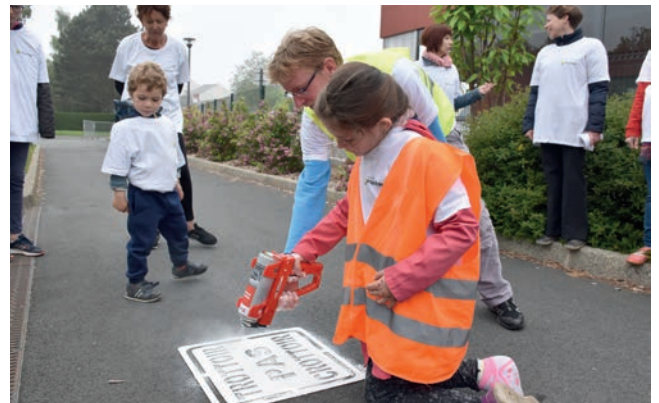
Sensibilisation au ramassage des déjections canines, quartier des Villes Moisan : 22 volontaires, enfants et parents.