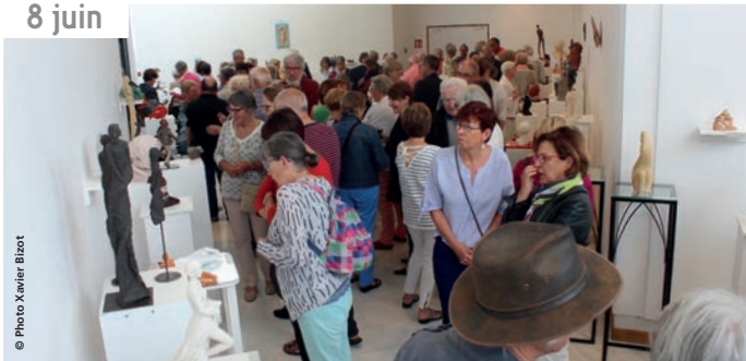
Vernissage de l'exposition Terres de sculpteurs à l'espace Victor Hugo.