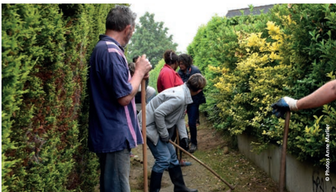
Nettoyage d'un chemin, rue d'Armor : 14 volontaires.