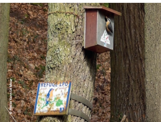
La sittelle torche-pot entrant dans le nichoir pour nourrir ses oisillons.

Une étude dirigée par le CNRS et le Muséum national d'histoire naturelle, publiée en mars 2018, pointe la disparition inquiétante des oiseaux des campagnes (leurs populations se sont réduites d'un tiers en quinze ans). Il appartient donc à tous de les protéger ou tout du moins de ne pas les mettre en danger, que ce soit en campagne ou en ville. Il en va de l'avenir de notre environnement. D'ailleurs, la loi conforte cette requête. En effet, il est interdit de détruire les nids et œufs d'oiseaux, de les enlever ou de les endommager, de transporter les petits, et même de les perturber de manière intentionnelle, pour les espèces protégées.