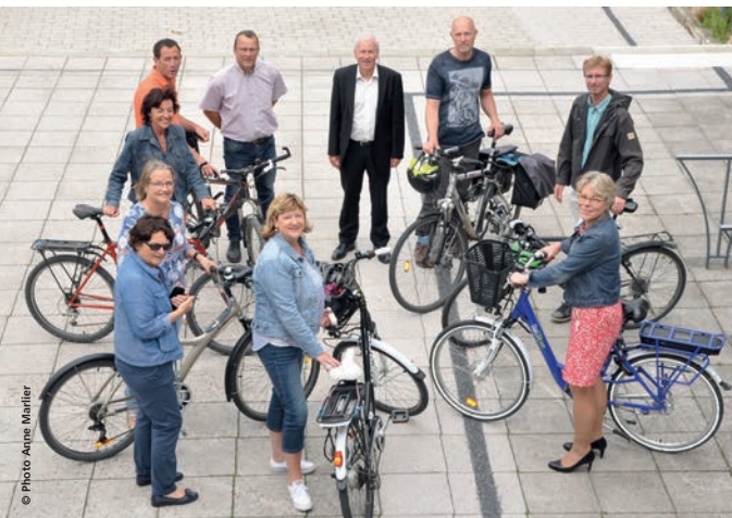
25 personnes (22 agents et 3 élus) de la Ville et du CCAS de Ploufragan ont participé au challenge du 26 mai au 3 juin.

Les agents de la Ville de Ploufragan se sont mis en selle pour la deuxième fois pour participer au challenge « A vélo au boulot », du 26 mai au 3 juin. En 2017, 780 km avaient été parcourus par 20 participants. Des chiffres en progression pour 2018 : 25 personnes ont parcouru 900 km malgré une météo plutôt pluvieuse (5 cyclistes occasionnels et 20 réguliers).