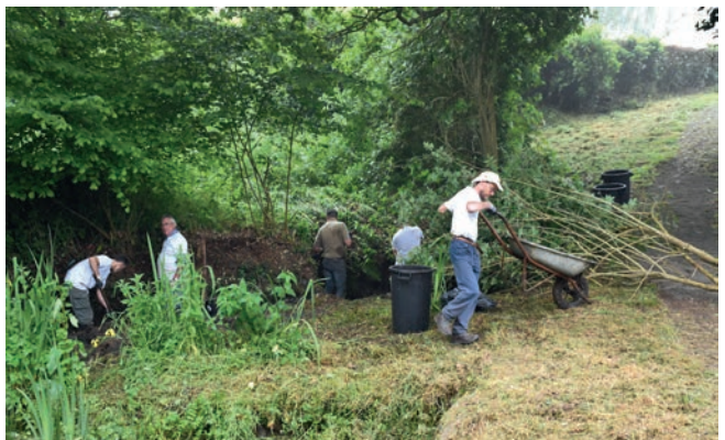
Régénération d'un lavoir et nettoyage d'un chemin rue des Castors : 14 volontaires.