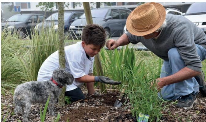
Plantations place d'Iroise, sous la houlette des Biaux jardins : 12 volontaires.