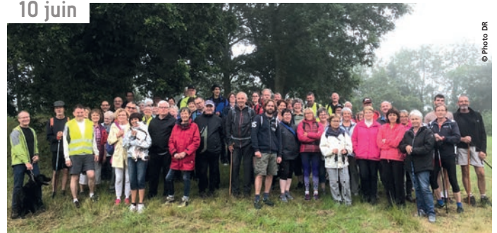
La randonnée de la Ville au Beau a permis au Comité de quartier de recueillir 100€ pour l'association Leucémie Espoir 22.