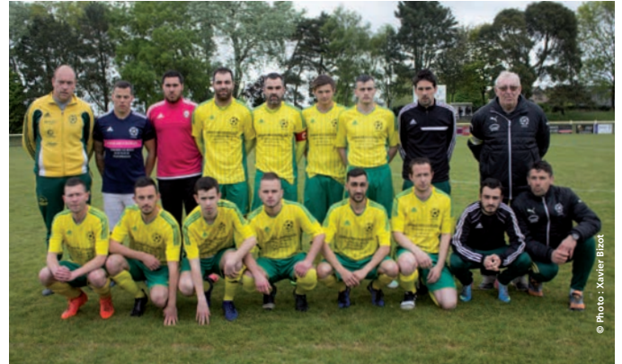
à 2017... L'équipe fanion finaliste de la coupe du Conseil Départemental le 1 er mai.

C'est un club de football en pleine forme qui s'apprête à fêter ses 40 ans ! En pleine forme du point de vue de ses effectifs, 209 licenciés cette saison.