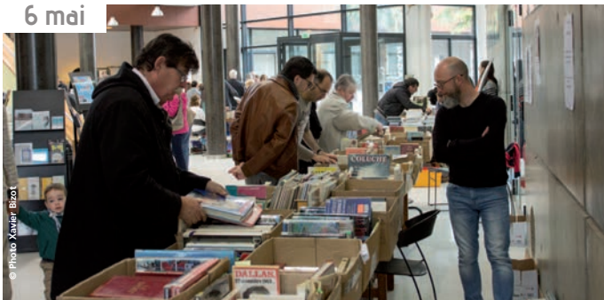
La Braderie du livre de la Médiathèque, et de l'Amicale laïque a attiré un public toujours aussi nombreux à l'espace Victor Hugo.