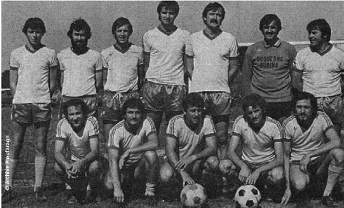
De 1977, l'équipe fanion du club...