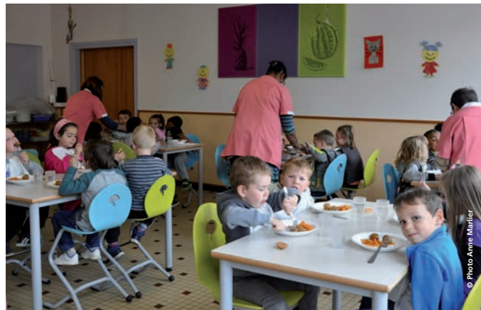
Le nouveau mobilier est installé au restaurant scolaire de la Vallée.