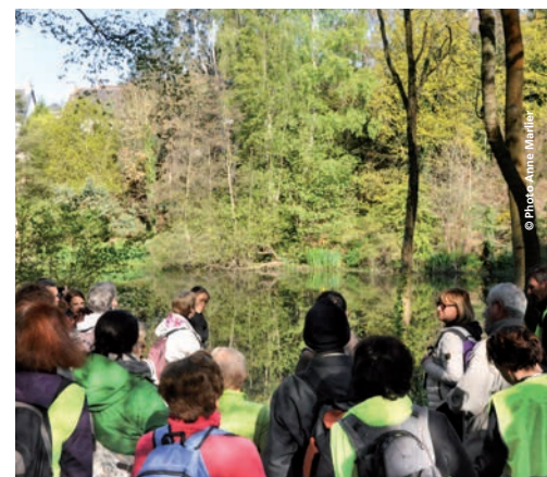
Aux Villes Cadorées, entretien de rivières avec l'AAPPMA.