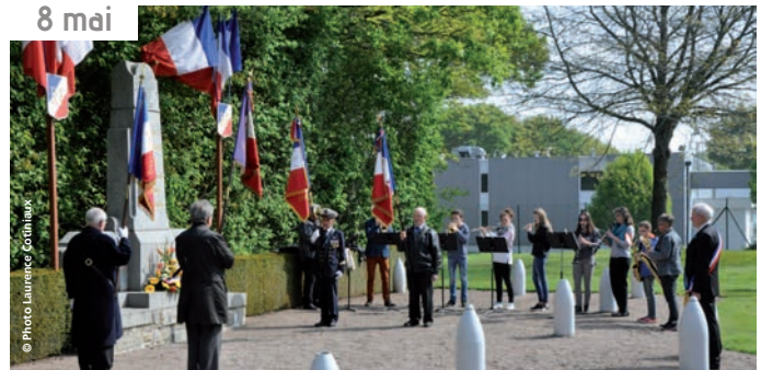
Commémoration du 8 mai 1945, avec la fanfare du Centre culturel, au monument des fusillés et au monument aux morts du centre-ville.