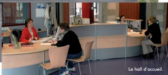
Le hall d'accueil.