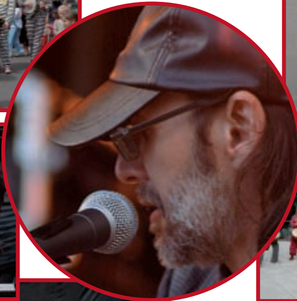
Les Repris de Justesse (fanfare très jazzy) ont déambulé dans les écoles au grand plaisir des enfants.