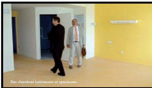
Des chambres lumineuses et spacieuses.