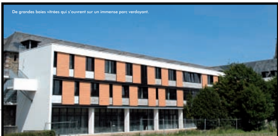
De grandes baies vitrées qui s'ouvrent sur un immense parc verdoyant.