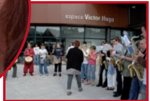
Une soirée très haute en musique avec les différents groupes de l'École de musique qui ont commencé la fête. La soirée s'est terminée avec Side Tracks et Heat Wave.