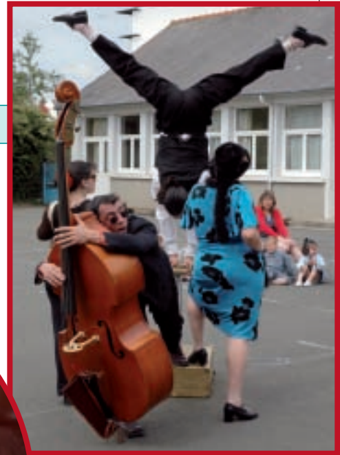
Spéctacle musical et d'acrobatie dans les écoles avec «Tais-toi vilaine».