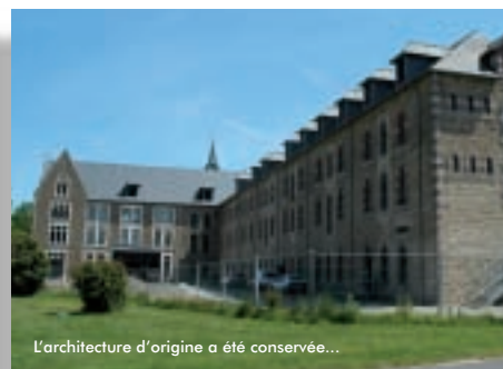
L'architecture d'origine a été conservée...

1- Adapter l'offre prioritaire aux besoins